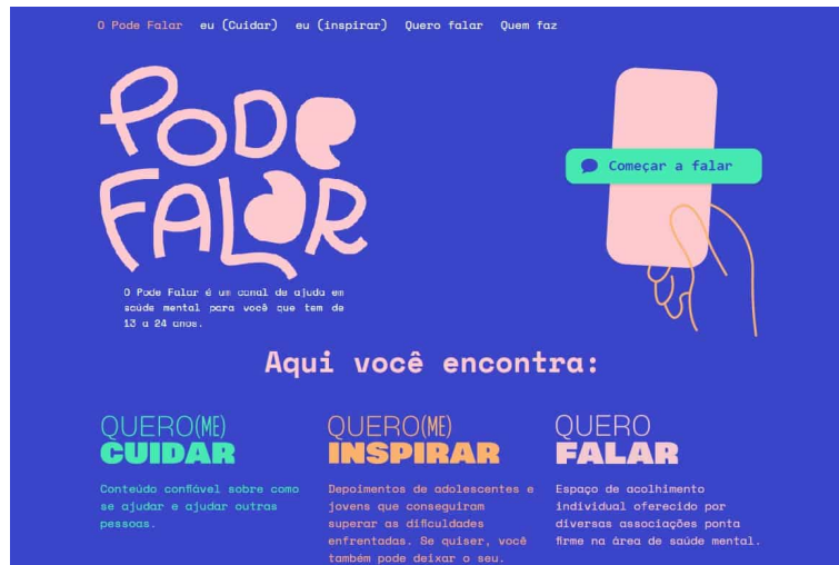
Imagem demonstra informações sobre projeto e como acessar o serviço - Foto: Pode Falar | UNICEF Brasil

Além disso, entendendo o impacto que a pandemia da COVID-19 causou no mundo, desenvolvemos o Healthbuddy. O projeto foi um chatbot desenvolvido pela Weni para o Unicef em parceria com a Organização Mundial da Saúde (OMS). O Healthbuddy é capaz de responder dúvidas sobre o COVID-19 usando Rapidpro e o nosso módulo de IA. O objetivo dele é fornecer informações confiáveis sobre COVID-19 e fornecer um canal para report de Fake News.